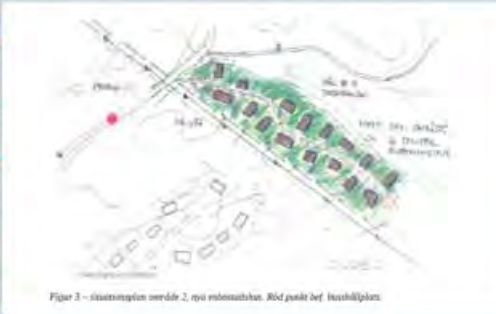
Figur 3 – översiktsplan område 2, nya bostadshuset. Röd punkt bef. husbillesplan